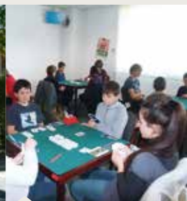
570 SCOLAIRES DANS LE COMITÉ. RECORD NATIONAL !