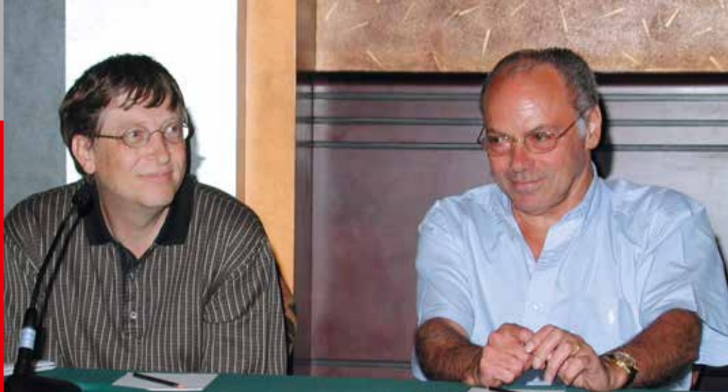
CONFÉRENCE DE PRESSE AVEC BILL GATES.

J'ai été de nombreuses fois capitaine d'équipes nationales. Mon expérience me démontre que le plus important pour un joueur est d'être aimable, je dirais même de choyer son partenaire et ses coéquipiers. Il convient d'éviter les discussions stériles qui nuisent à la cohésion de l'équipe, au confort mental de ses membres et n'apportent rien de positif. Bien au contraire.