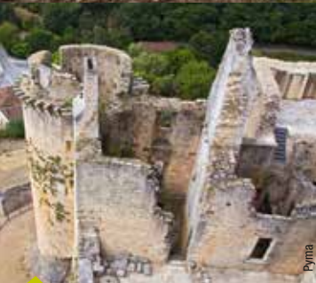
LE CHÂTEAU DE BONAGUIL.

« Quel trac, quel stress ! » me disaient en janvier dernier à la veille du championnat de France des Écoles de bridge, les nouveaux élèves, pourtant déjà passionnés. Ils furent nombreux dans les clubs de notre comité à participer à cette formidable initiative qui permet d'accéder aux premiers tournois et ils sont de plus en plus nombreux au seuil de la retraite à s'investir dans les clubs, épaulés par une méthode accessible et claire. Beaucoup de nos anciens nous ont hélas quittés ces derniers mois mais la relève s'annonce avec ces nouveaux joueurs, jeunes et moins jeunes, qui viennent, appuyés par leurs enseignants, approfondir leur apprentissage et tisser des liens autour de notre jeu de cartes. Ils ne manqueront pas de rejoindre bientôt nos événements traditionnels, tournois caritatifs ou festivals toujours aussi fédérateurs de convivialité et dont l'on repart avec de belles donnes à discuter et quelques bonnes bouteilles de nos célèbres « Bordeaux » en trophée.