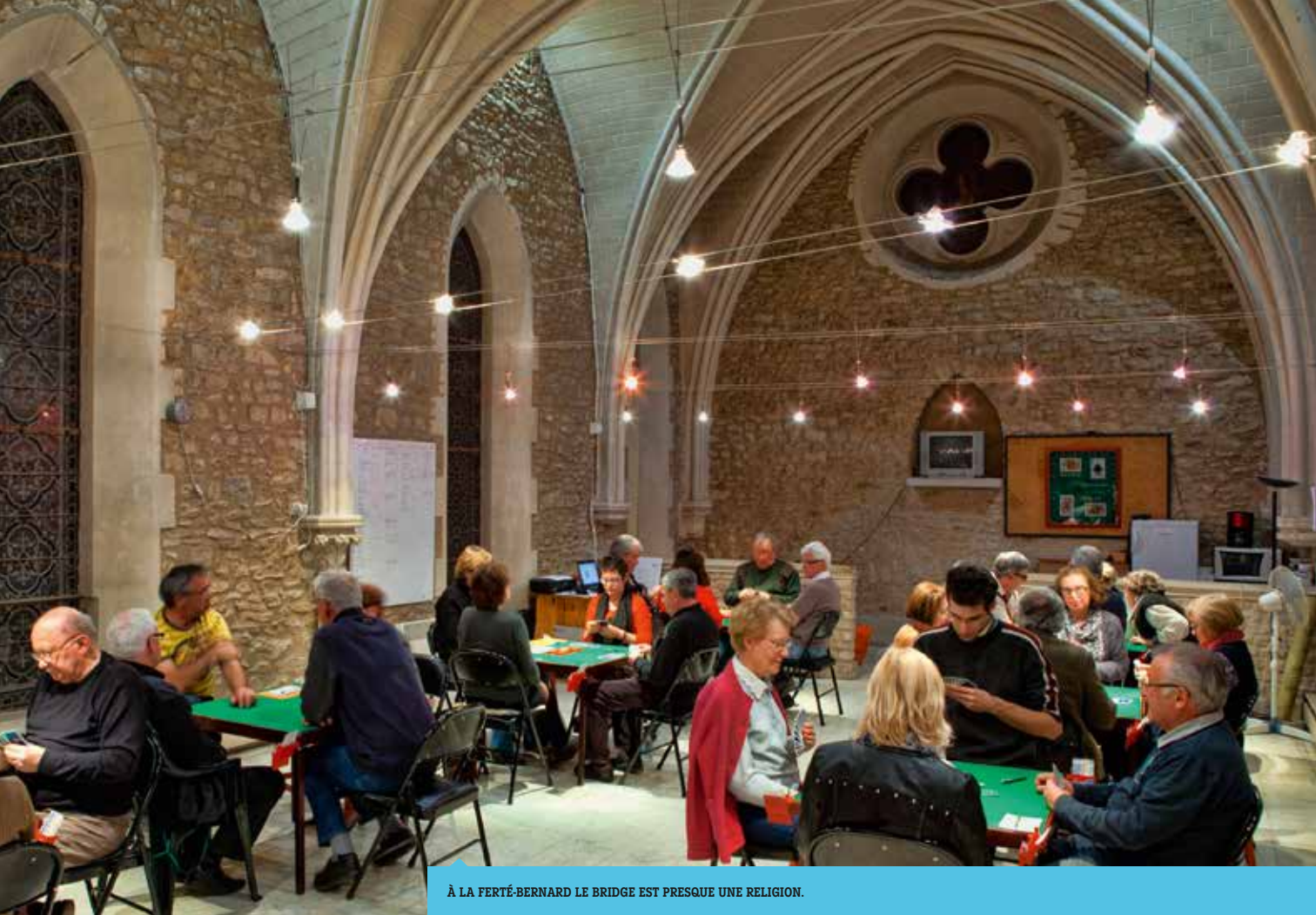
À LA FERTÉ-BERNARD LE BRIDGE EST PRESQUE UNE RELIGION.