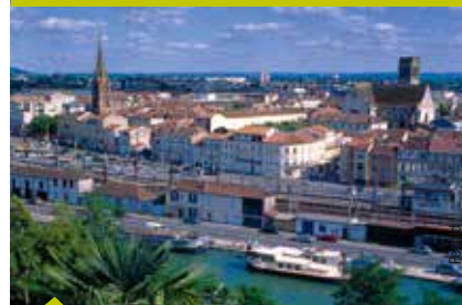
AGEN, LA CAPITALE DU PRUNEAU.

de retrouver le vôtre ! Pourtant je vais vous y reconduire cet après-midi.