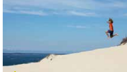
LA DUNE DU PYLA.

« À propos de château, monsieur de Montaigne, vous ne semblez pas pressé