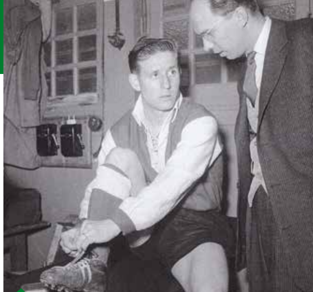
AVEC RAYMOND KOPA, PREMIER FRANÇAIS LAURÉAT DU BALLON D'OR EN 1958.