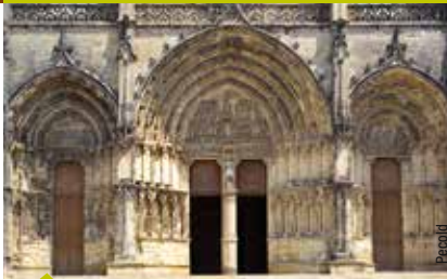
LA CATHÉDRALE SAINT-JEAN-BAPTISTE À BAZAS.