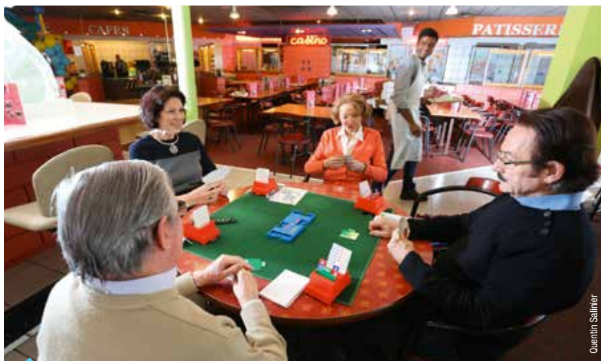
LE CLUB DE BORDEAUX CAUDÉRAN A TROUVÉ LA BONNE FORMULE DANS UNE CAFÉTÉRIA.

car la voûte culmine à 7-8 mètres au-dessus de la tête des joueurs. « Quand les adhérents des clubs de villes voisines découvrent le décor dans lequel ils vont disputer une compétition, ils ne peuvent se retenir, s'amuse-t-il. Vous avez le plus beau club de la région, s'exclament-ils. »