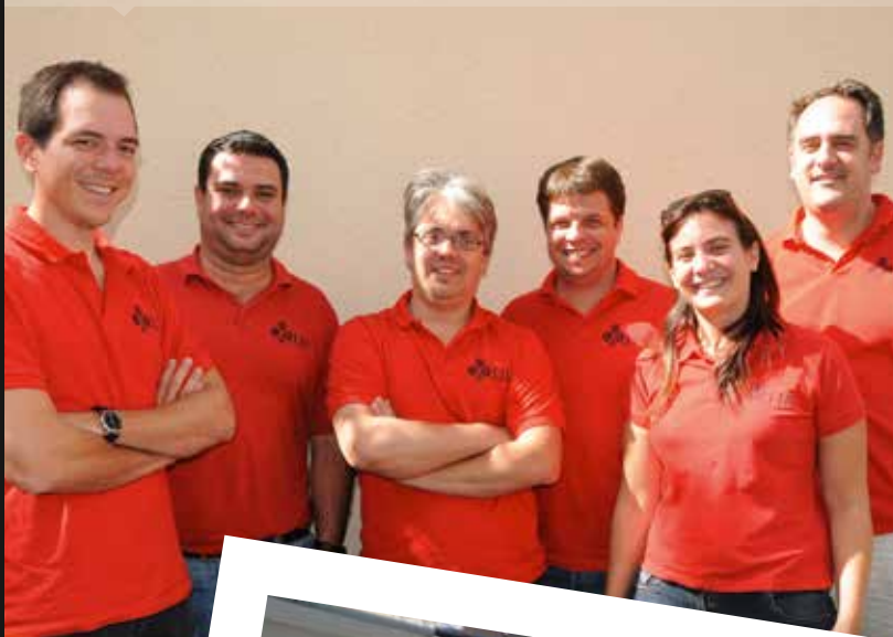
L'ÉQUIPE DU QUAI LYONNAIS DES JEUNES BRIDGEURS, FINALISTE DE L'INTERCLUBS 2013, MONTRE L'EXEMPLE.

T -shirt, polo, chemise ou gilet : tous les joueurs des équipes qualifiées pour les finales nationales de l'Interclubs 1 ère , 2 ème , 3 ème et 4 ème division devront, dès cette année, porter les couleurs de leur club. Une initiative du Bureau Exécutif de la FFB qui souhaite que l'identification au club d'origine soit ainsi valorisée. La boutique de la FFB peut vous conseiller. Renseignements : boutique@web.ffbridge.net