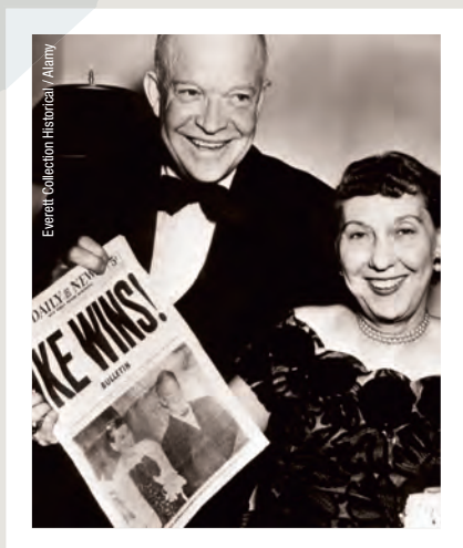
« Ike » et Mamie Eisenhower après la réélection de 1956.