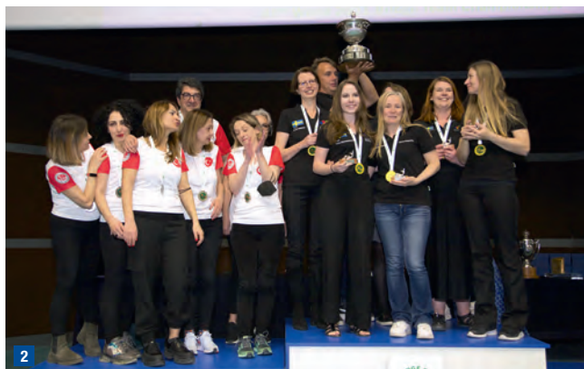
2 LA SUÈDE REMPORTE LA VENICE CUP POUR LA DEUXIÈME FOIS CONSÉCUTIVE, DEVANT UNE JEUNE ET INATTENDUE ÉQUIPE TURQUE.