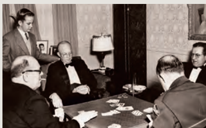
Bridge à la Maison Blanche : un samedi soir comme les autres.