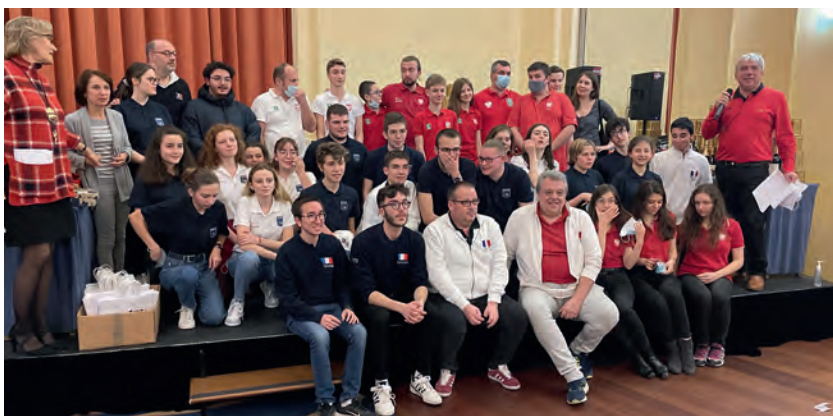
LES QUATRE CATÉGORIES FRANÇAISES ET POLONAISES (U16, U21, U26 ET « GIRLS ») RÉUNIES AVEC LEURS COACHS SUR LE PODIUM DE L'AMITIÉ.