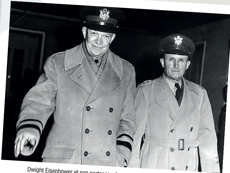
Dwight Eisenhower et son partenaire favori, le général Alfred Gruenther, alors chef suprême des forces de l'OTAN.