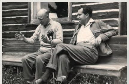
En week-end avec Richard M. Nixon, qui échouera bientôt à l'élection de 1960 contre John F. Kennedy.