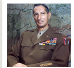
Mark Clark, ex-commandant des forces de l'ONU et adversaire de toujours d'Eisenhower au bridge.