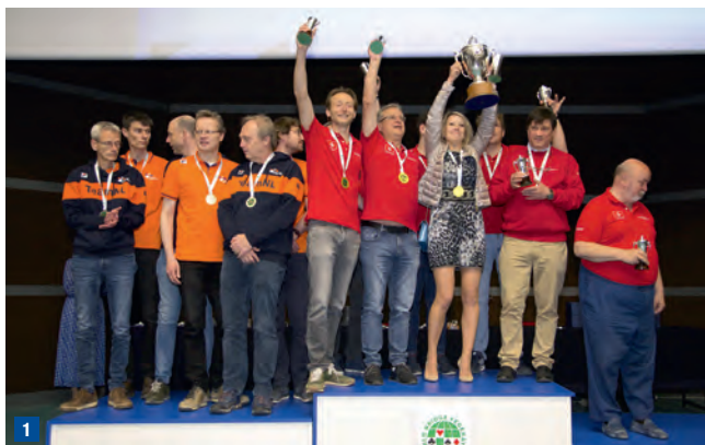
1 DANS LA BERMUDA BOWL, 3 IMP SEULEMENT SÉPARENT LES PAYS-BAS DE LA SUISSE.